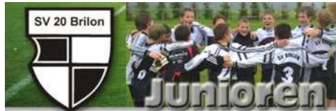
Ausrichter SV 20 Brilon e.V. - Jugendabteilung